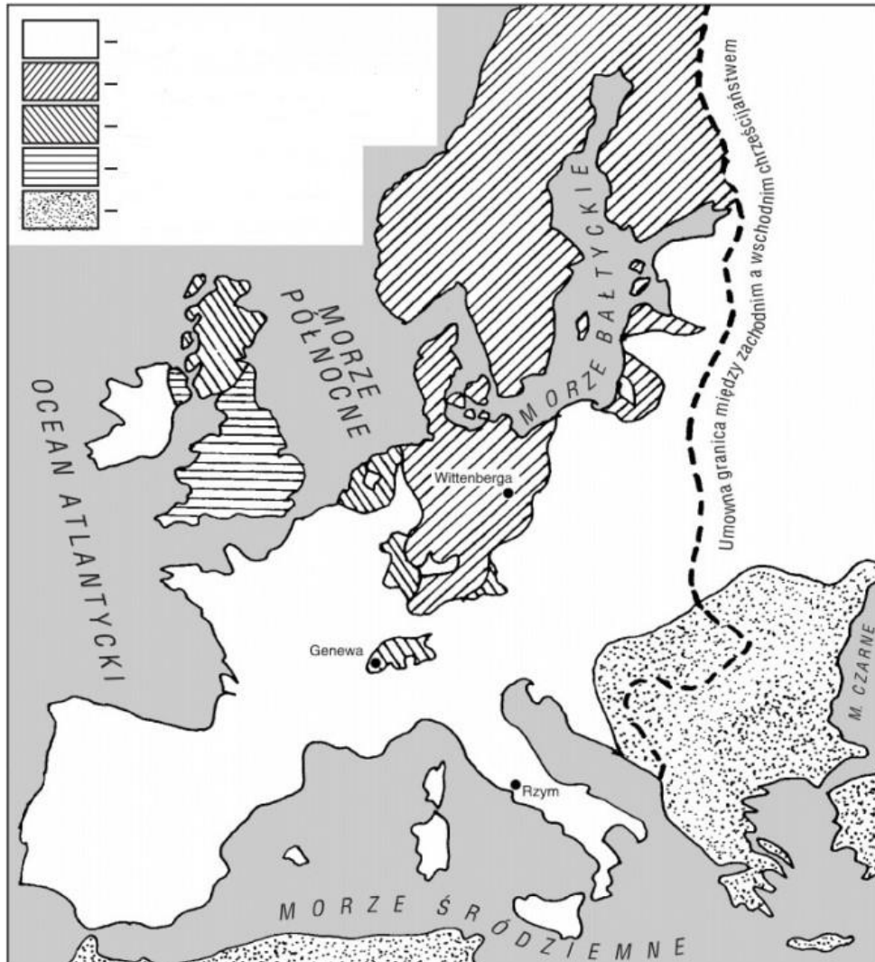
Podział religijny Europy na przełomie XVI i XVII wieku

anglikanizm, imperium otomańskie, kraje katolickie, tereny z przewagą luteranizmu, tereny z przewagą kalwinizmu