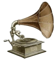
E - ....