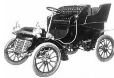
C - ....