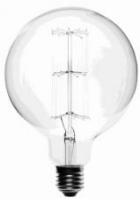
A - ....